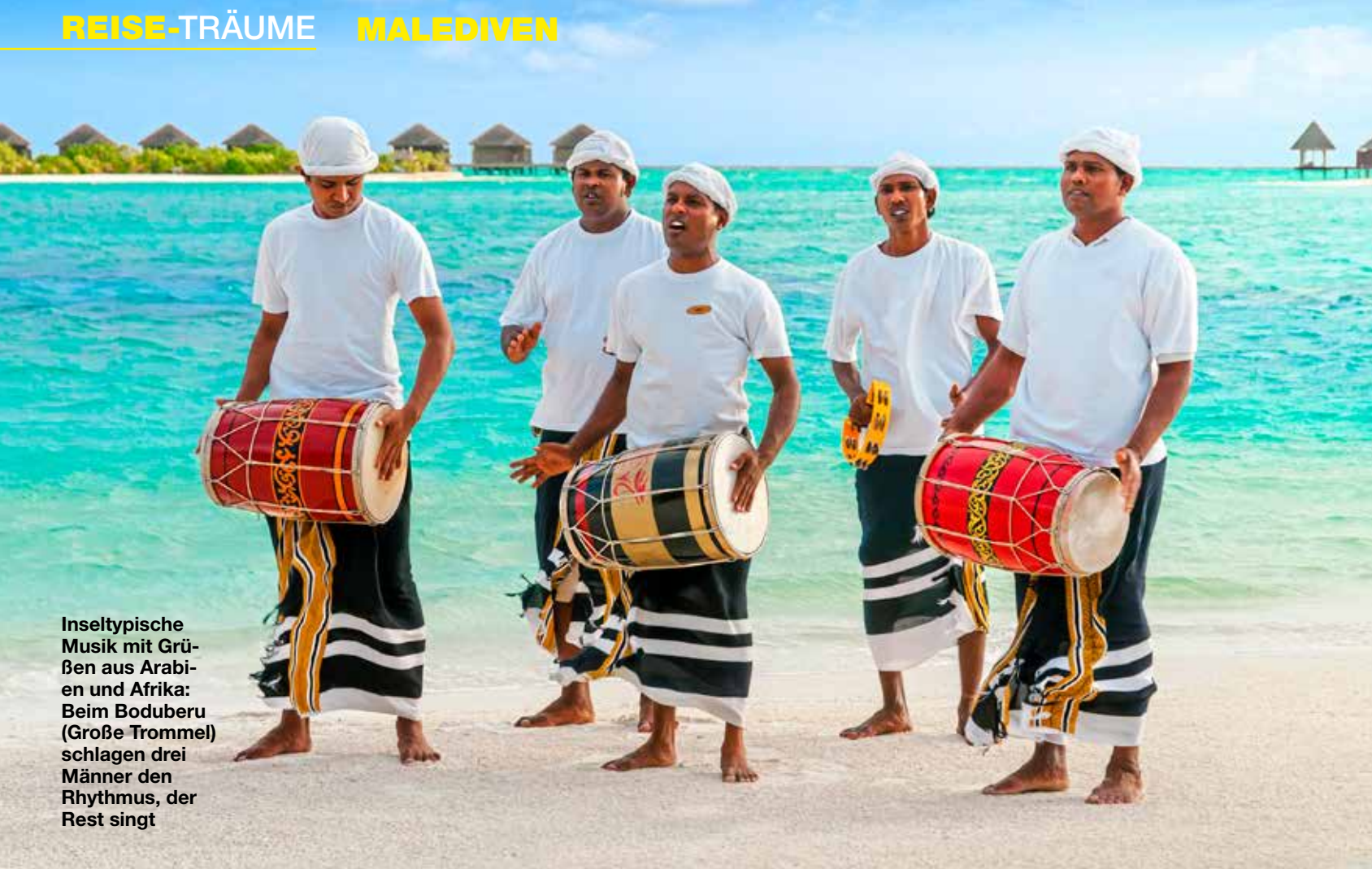
Inseltypische Musik mit Größen aus Arabien und Afrika: Beim Boduberu (Große Trommel) schlagen drei Männer den Rhythmus, der Rest singt