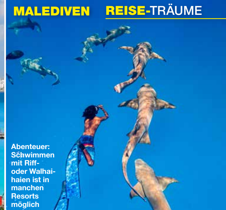
Abenteuer: Schwimmen mit Riff- oder Walhaihaien ist in manchen Resorts möglich

Auf den wenigen Inseln, die nur von Einheimischen bewohnt sind, ist das Leben sehr einfach im Kontrast zum Luxus auf den Hotelinseln. Frauen flechten aus Palmenblättern Matten für ihr Haus