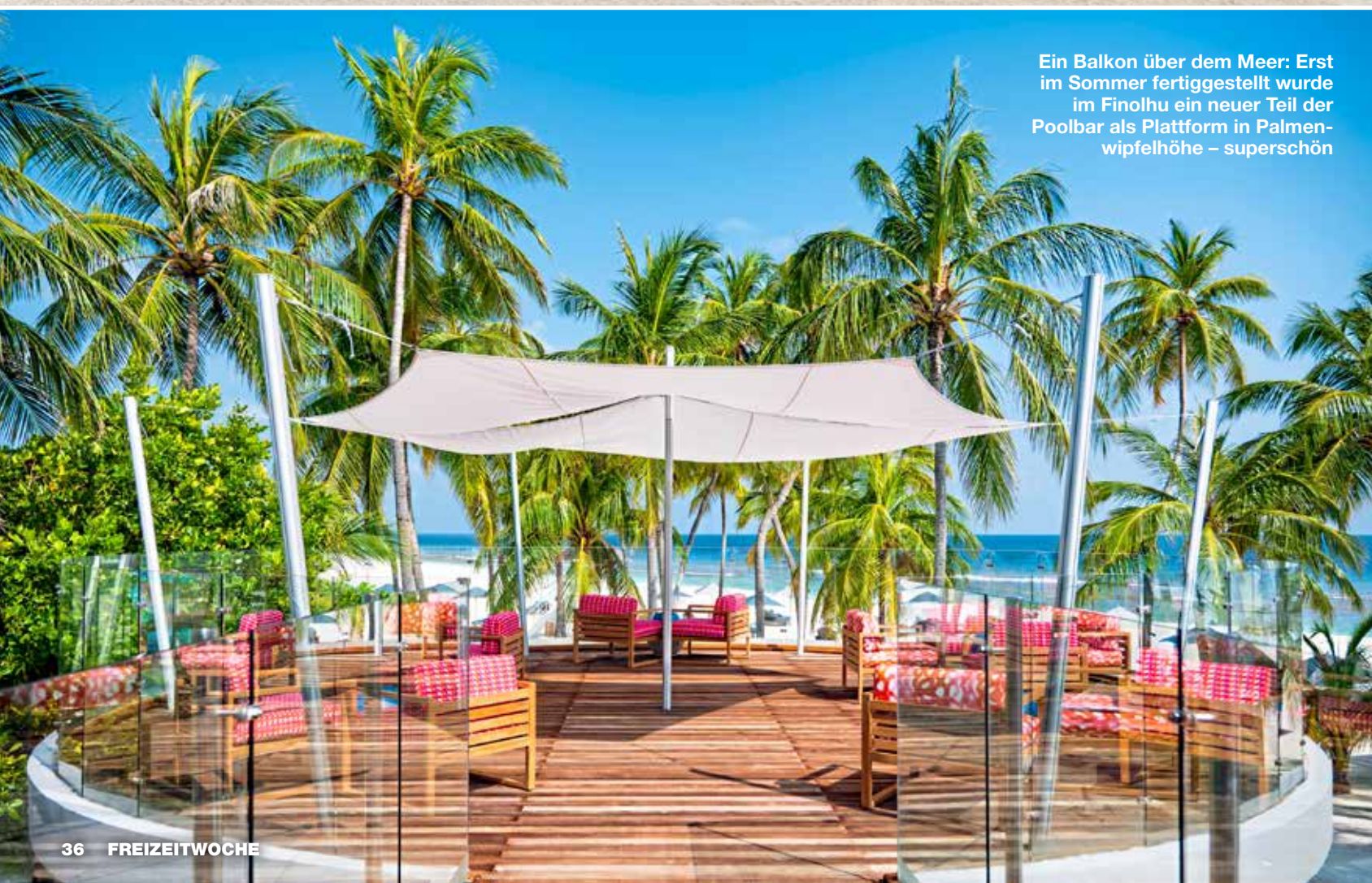
Ein Balkon über dem Meer: Erst im Sommer fertiggestellt wurde im Finolhu ein neuer Teil der Poolbar als Plattform in Palmenwipfelhöhe – superschön