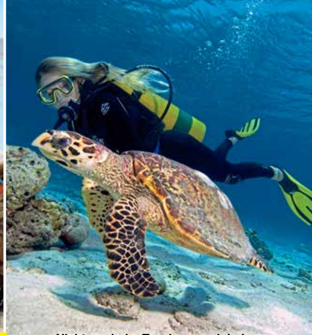
Nicht nur beim Tauchen, auch beim Schnorcheln kommt man Meereschildkröten fast hautnah