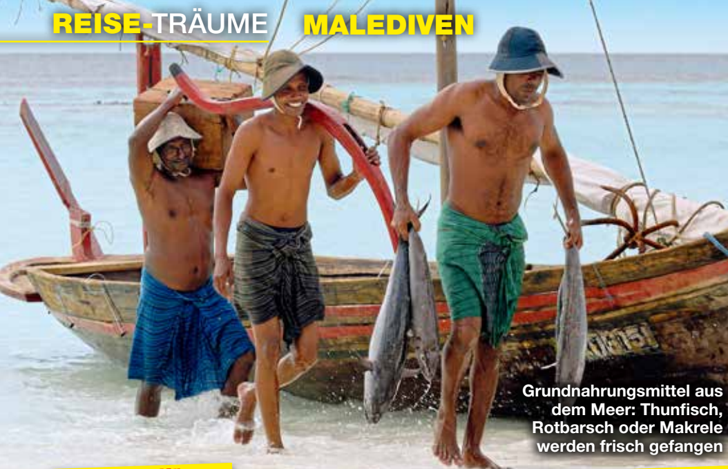
Grundnahrungsmittel aus dem Meer: Thunfisch, Rotbarsch oder Makrele werden frisch gefangen

Bei starkem Wind über die Wellen an der Kante eines Riffs reiten oder surfen – nicht einfach!