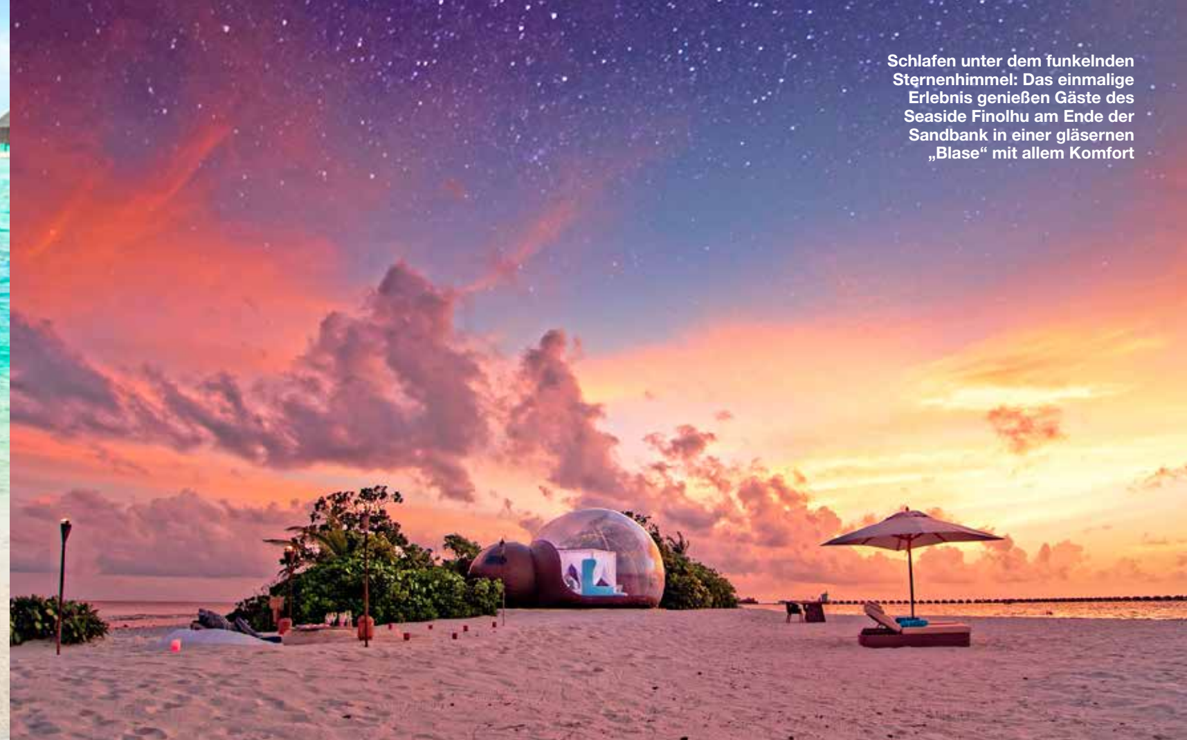
Schlafen unter dem funkelnden Sternenhimmel: Das einmalige Erlebnis genießen Gäste des Seaside Finolhu am Ende der Sandbank in einer gläsernen „Blase“ mit allem Komfort