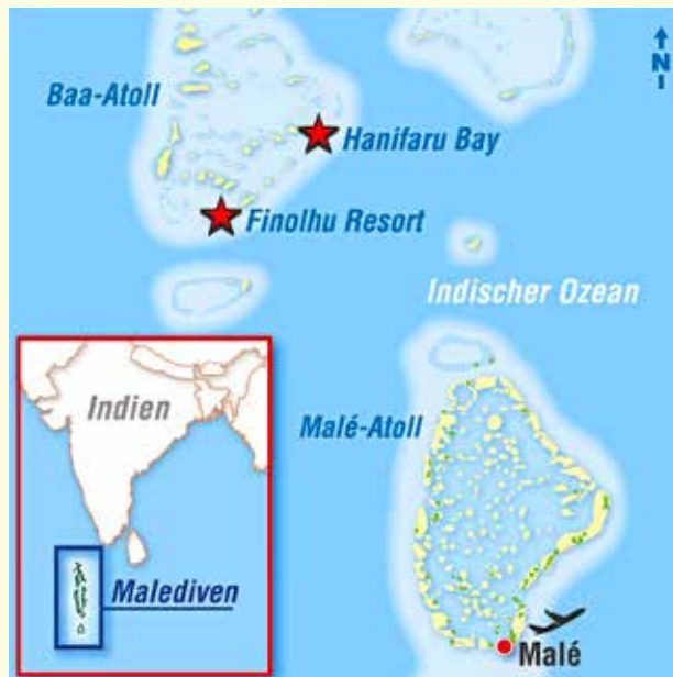
Karte: Planstelle; Foto: PR (3)

Zurück im Finolhu ist die Sonne untergegangen und die grün überwucherten Sandwege sind magisch beleuchtet. Wohin also zum Abendessen? Im Hauptrestaurant lockt ein Büffet, im Kanusan feine asiatische Küche und im Arabian Grill sitzt man in einer Kulisse wie aus 1001 Nacht unter Palmen und lauscht dem Klang des Ozeans – ein romantischer Inseltraum! Petra Kirsch