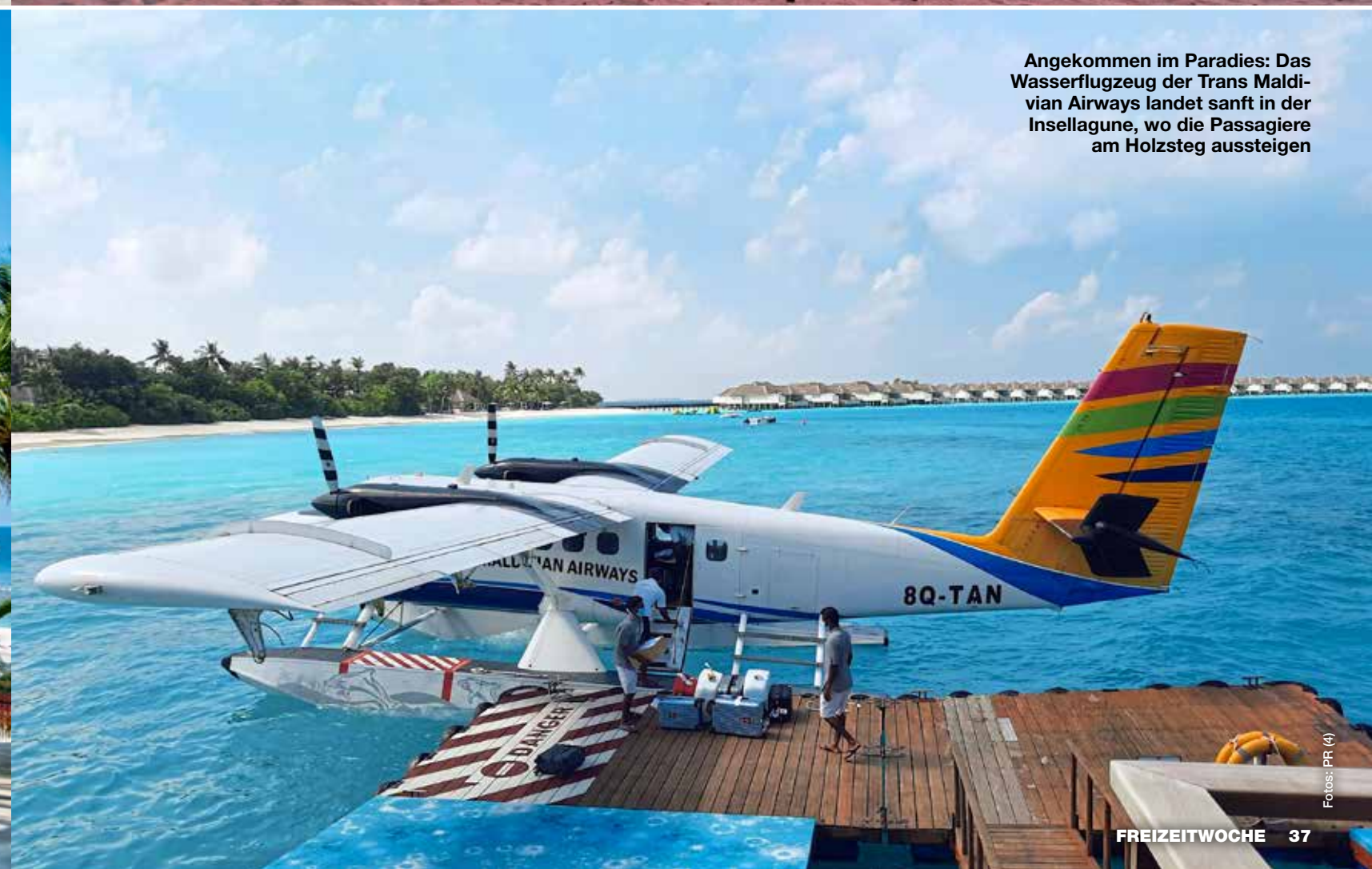
Angekommen im Paradies: Das Wasserflugzeug der Trans Maldivian Airways landet sanft in der Insellagune, wo die Passagiere am Holzsteg aussteigen