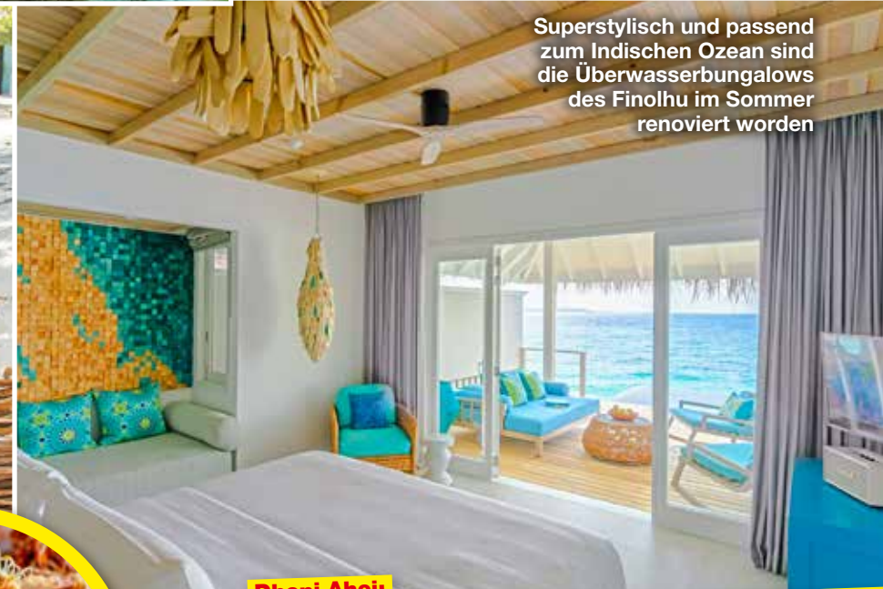
Superstylish und passend zum Indischen Ozean sind die Überwasserbungalows des Finolhu im Sommer renoviert worden

Segel- oder Motor-Dhonis sind die traditionellen Verkehrsmittel der maledivischen Inselwelt